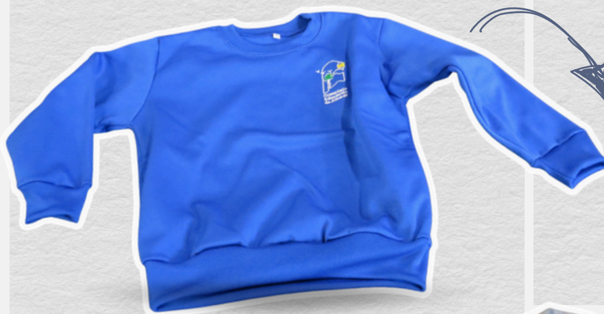
Buzo abrigo Con logo