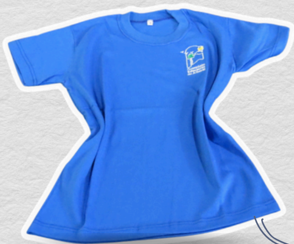
Remeras Manga Larga Manga Corta