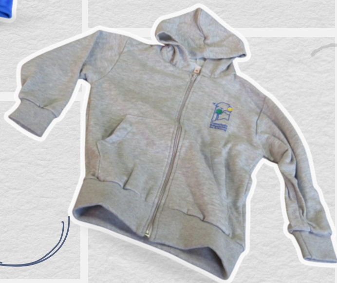
Campera abrigo Con logo